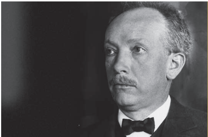
Richard Strauss, 1908 in London

Anspruch: »Für mich ist das poetische Programm«, so Strauss, »auch nichts anderes als der Formen bildende Anlass zum Ausdruck und zur rein musikalischen Entwicklung meiner Empfindungen; nicht wie sie glauben, bloß eine musikalische Beschreibung gewisser Vorgänge des Lebens. Das wäre doch ganz gegen den Geist der Musik. Aber dass die Musik nicht in reine Willkür sich verliere und ins Uferlose schwimme, dazu braucht sie gewisser Form bestimmender Grenzen und dieses Ufer formt ein Programm. Und mehr als ein gewisser Anhalt soll auch für den Hörer ein solch analytisches Programm nicht sein. Wen es interessiert, der benütze es. Wer wirklich Musik zu hören versteht, braucht es wahrscheinlich gar nicht.«