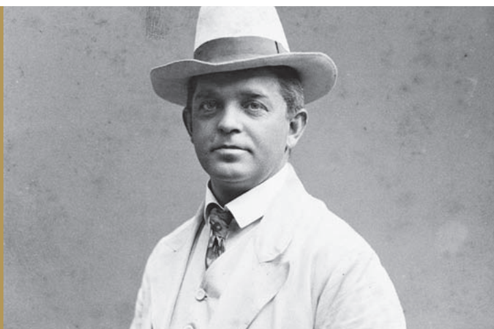
Carl Nielsen, 1931

Betrachtung ländlicher Stimmungsbilder überkamen und die er in Klang umwandelte. Die Auswahl der schöpferischen Anknüpfungspunkte blieb indes keineswegs unumstritten, wie ein heftiger Richtungsstreit zwischen den Anhängern von »Programm- und »Absoluter Musik« in der zweiten Hälfte des 19. Jahrhunderts unterstreicht. Er erhitzte die Gemüter und spaltete die Musikwelt in zwei Lager – wobei sich beide Lager auf Beethoven beriefen. Während sich die »Neudeutsche Schule« um Franz Liszt und Richard Wagner mit Programmsinfonie und Musikdrama als »musikalische Fortschrittspartei« verstand, scharten sich die Verfechter »absoluter Musik« um den vermeintlich konservativen Johannes Brahms als legitimen Vollstrecker des klassischen Erbes; während die »Neudeutschen« die »poetische Idee« als kompositorische Grundlage hervorhoben, konterte das wortgewandte Sprachrohr der Gegenpartei, der Wiener Kritikerpapst Eduard Hanslick, mit der »tönend bewegten Form«.