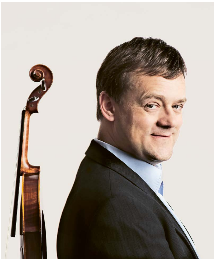
Frank Peter Zimmermann