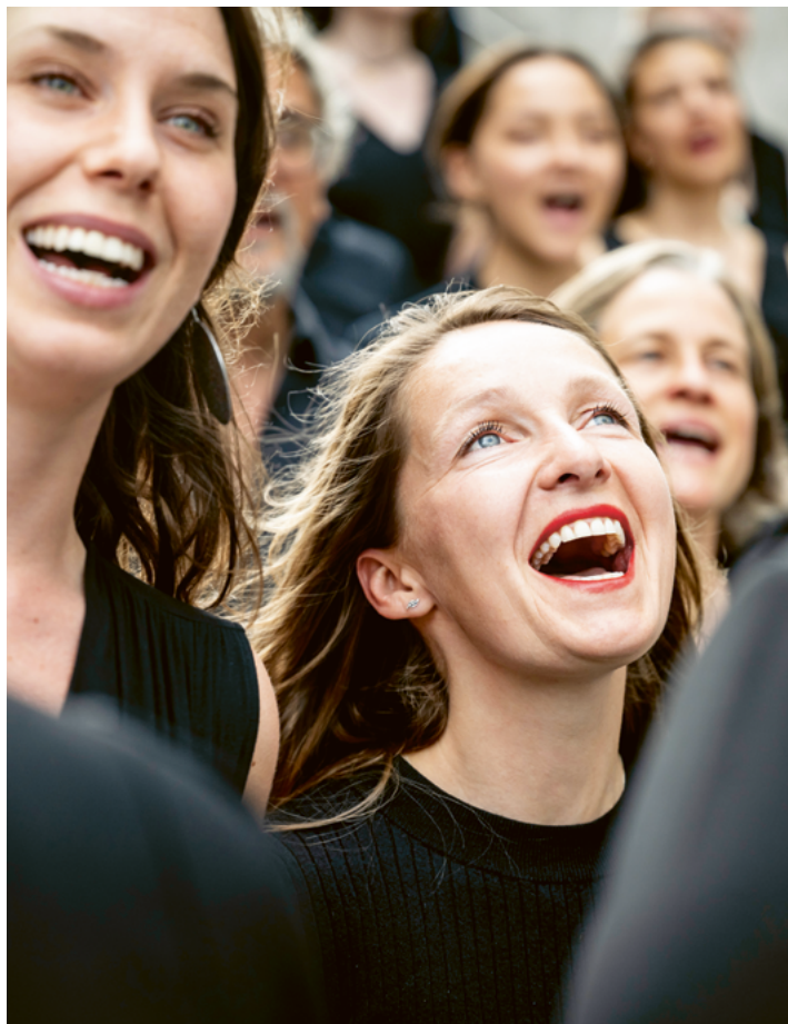
Begeisterung und Freude am gemeinsamen Musizieren im Kölner Bürgerchor