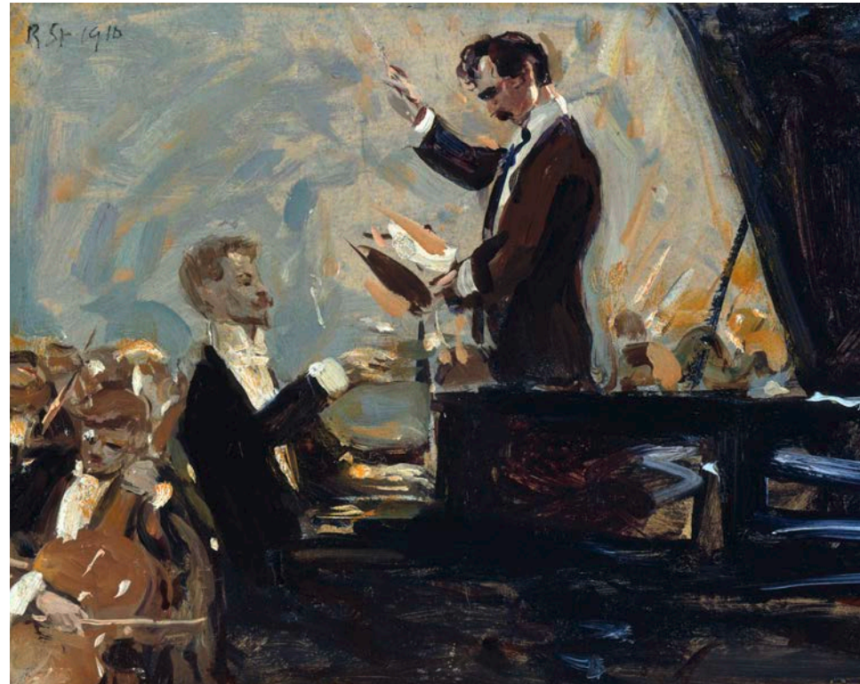
Alexander Skrjabin spielt sein Klavierkonzert unter der Leitung von Sergej Kussewitzki, Gemälde von Robert Sterl, 1910

Die nächste Skrjabin-Sinfonie sollte ein Poème divin sein, ein göttliches Poem, gefolgt von einem Poème de l'extase und einer Hymne an den mythischen Feuerbringer Prometheus: Poème du feu – Prométhée . Skrjamins sinfonisches Schaffen blieb groß denkend und alle gewohnten Formen sprengend. Die Verwirklichung seines Opus maximum aber blieb ihm versagt, denn Skrjabin starb mit 43 Jahren an einer Blutvergiftung. Es hätte Mysterium heißen und ein Werk sein sollen, das Musik mit Dichtung, Tanz, Architektur, Düften, Berührungen und gar mit dem Funkeln der Sterne verbindet. Die Vision der Vereinigung aller Künste und Sinnesempfindungen blieb also eine Utopie.