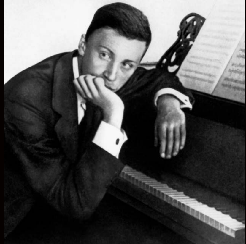
Sergej Prokofjew am Klavier, 1910

Komponisten Orchesterwerke in monumentaler Besetzung und mit einer Spieldauer von 40, 50 und mehr Minuten schrieben, schuf Prokofjew eine transparente, tänzerisch gefärbte Sinfonie von gerade einmal einer Viertelstunde Länge, leicht, luftig – und gerade deswegen so »neu« und alles andere als verzopft-epigonal.